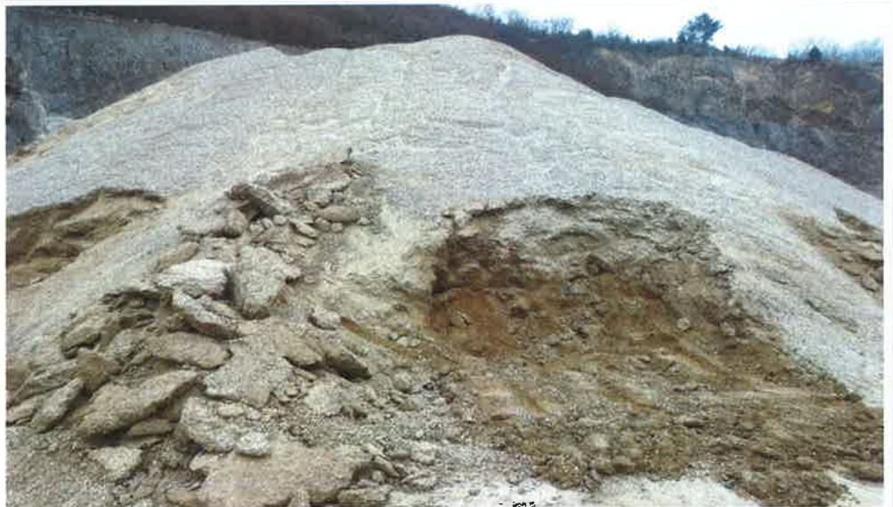
Abbildung 1: Übersicht des Zwischenlagers bei der Probenahme