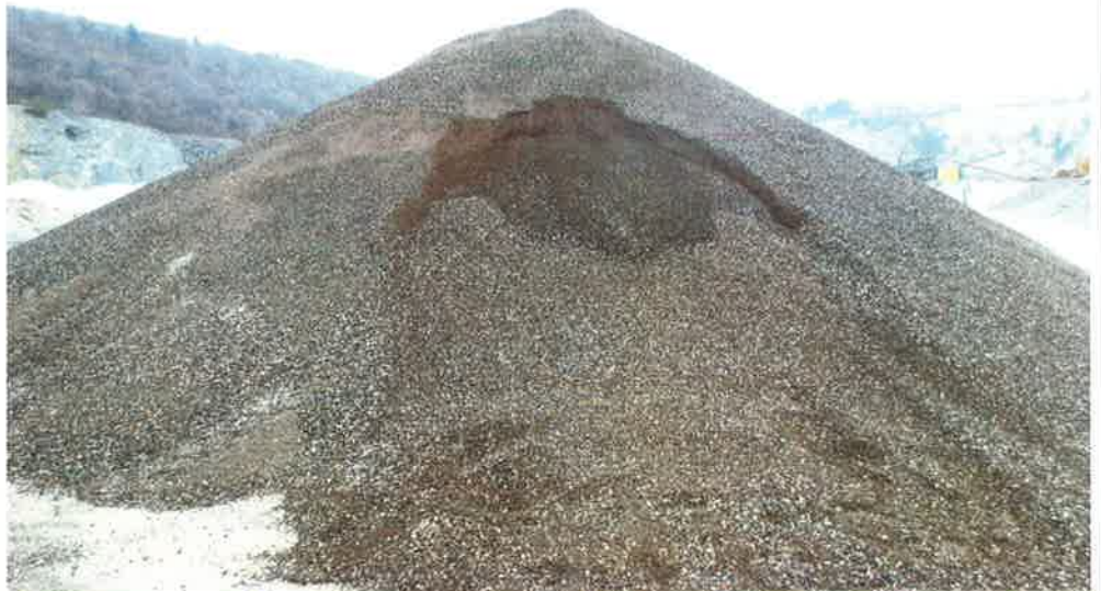
Abbildung 1: Übersicht des Zwischenlagers bei der Probenahme